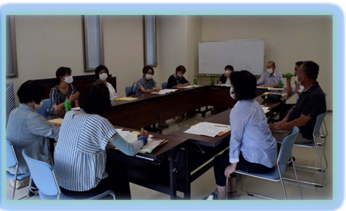
意見交換する福祉委員と民生児童委員