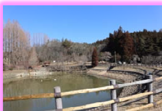
③永田深洞親水公園