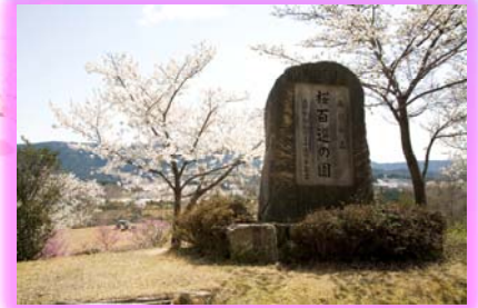
②横ヶ根 西行の森桜百選の園公園