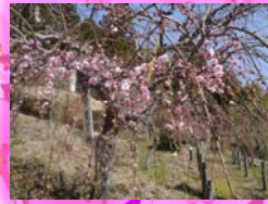
永田梅露庵公園の枝垂梅は3月が見頃。来年はぜひ梅も見てください。