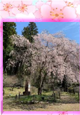
①永田梅露庵公園の中心には京都丸山公園の祇園枝垂桜二世が見られます。