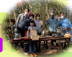
森のカフェの皆さん