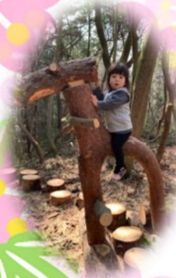
遊歩道頂上部の遊具