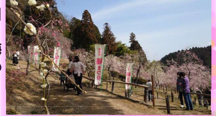
会場を散策する皆さん

わらじ五平は大人気、定番の綿菓子、祝い餅配り、新たな趣向で お菓子のつかみ取り、梅露庵遊歩道頂上部の森のカ フェでは淹れ立てコーヒーを無料で楽しんでいただき ました。