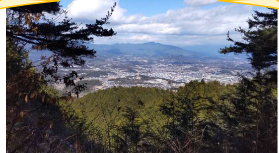
立春 正家馬はげよりニッ森山を望む