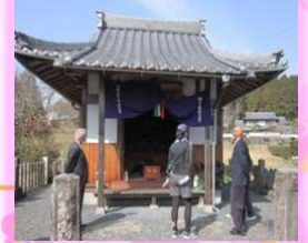
梅露庵観音堂も御開帳

3月12日(日) 永田区の西行梅露庵公園で、永田 区主催による梅まつりが3年ぶりに開催されました。 また、近くにある梅露庵観音堂も同日御開帳されました。梅 は満開に近く、予想を上回る延べ370人の花見客でにぎわ いました。