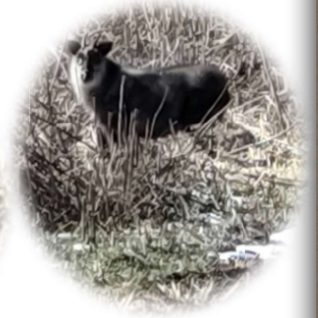
ニホンカモシカに遭遇

令和5年度長島地域と学校を「つなぐ」 カレンダーを作りました。地域行事、長島 小学校・恵那西中学校の行事予定がひとめ でわかります。ご活用下さい!!