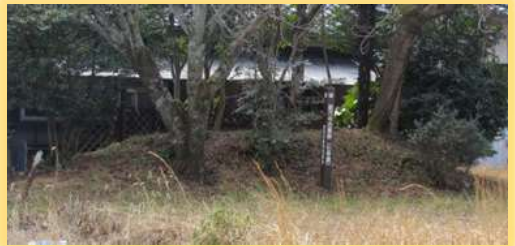
現在の能万寺7号古墳

武器、金銅製耳環や勾玉といった装身具、須恵器や土師器といった土器類が出土しています。鉄刀は、直刀で長さが72cmあります。