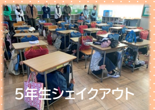
5年生シェイクアウト