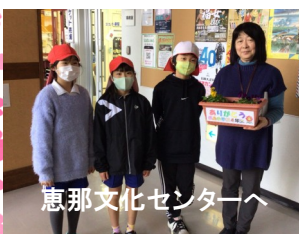
恵那文化センターへ

12月2日(火)長島町壮健クラブ連合会15名の方々に指導いただき、長島小学校4年生がフラワーロードに飾る花を植えました。同時に、長島小学校学区地域学校協働活動の一環で小さなフランチーに花を植え、ありがたのメッセージをそえて長島町内の施設に子どもたちが届けました。