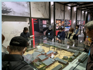
かぶとビール施設見学