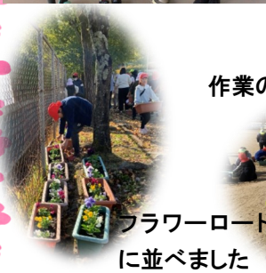
フラワーロードに並べました