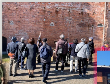
赤レンガ建物見学