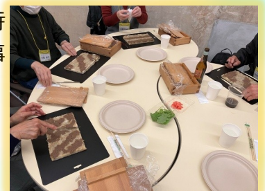
具は思い思いの柄に