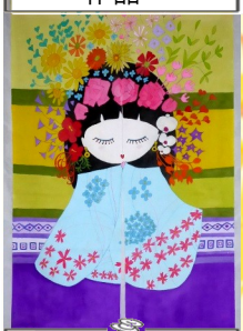
最優秀賞 足立香織さんの 作品