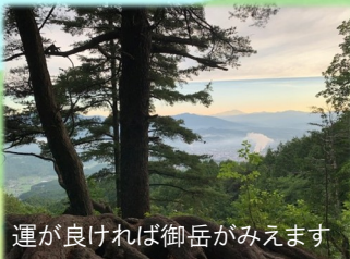
運が良ければ御岳が見えます