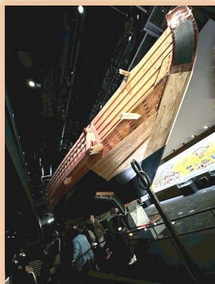
ミツカンミュージアム