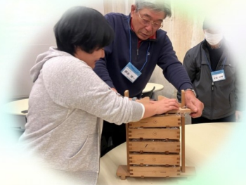
箱すし5段を押します

明治時代に建てられた赤レンガ建物で、いろいろな種類の酢の説明を聞き、試飲して実際の味の違いを体験しました。次に半田市の郷土料理発酵食「箱すし」を自分で作り、発酵食品の製造過程を学びました。赤レンガ建物はかつてカブトビールの工場でした。現在は国の登録有形文化財・近代化産業遺産で、展示施設や会議室として利用されています。午後は、半田運河沿いにあるミツカンミュージアムを見学しました。ガイドの方の説明を聞きながら2時間、発酵の歴史や醸造技術について学ぶ事が出来ました。